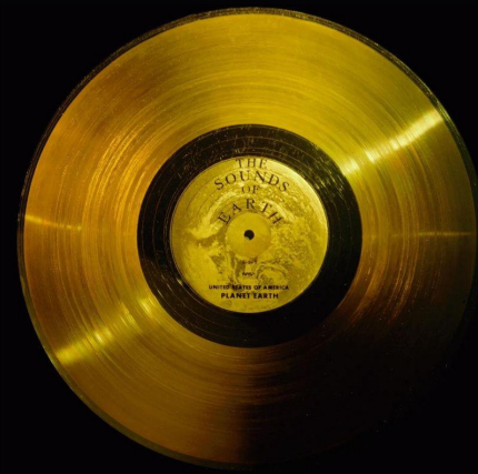
Golden Voyager Record